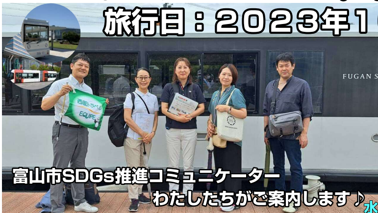
富山市SDGs推進コミュニケーター わたしたちがご案内します♪