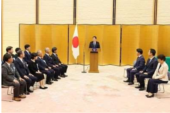
岸田総理 介護職員の働きやすい職場環境づくり内閣総理大臣表彰・厚生労働大臣表彰 表彰式—令和5年8月24日

令和5年8月24日、総理大臣官邸で令和5年度介護職員の働きやすい職場環境づくり内閣総理大臣表彰表彰式が行われ、ささづ苑かすがが介護人材の確保に資する、職員の待遇改善、人材育成、介護現場の生産性向上の取組が特に優れた介護事業者として、岸田総理から表彰状を授与していただきました。