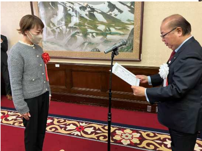
◀ デイおおくぼの森