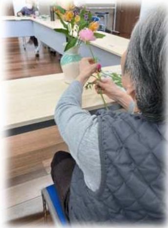
黙々と作業をされています