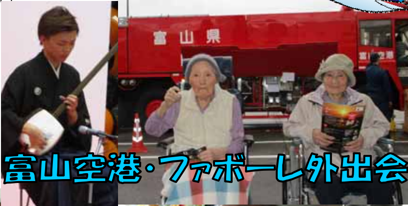
富山空港・ファボーレ外出会