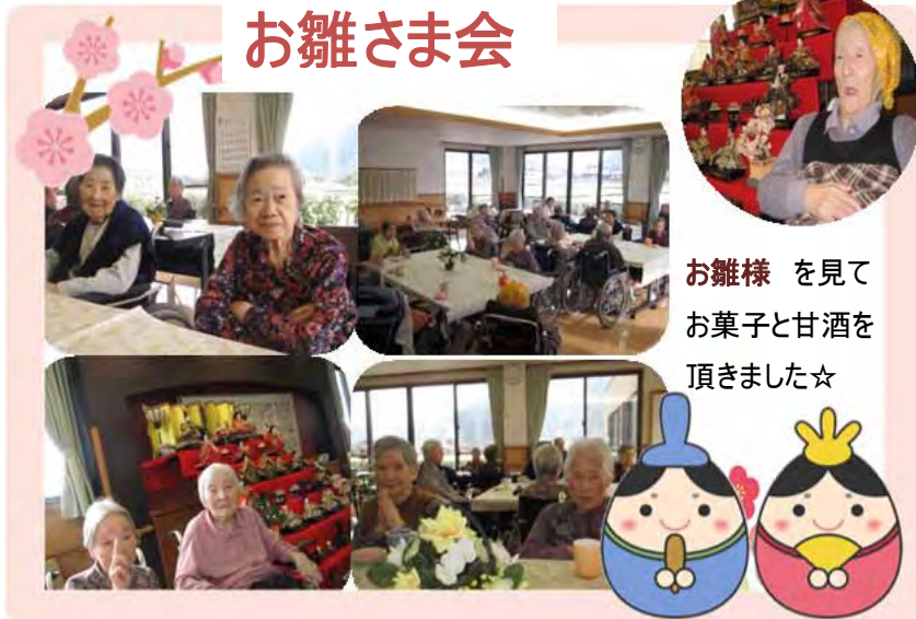
お雛様を見て お菓子と甘酒を 頂きました☆