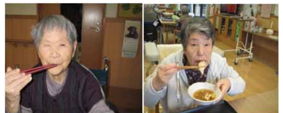
ぶりのおろし鍋を頂きました！