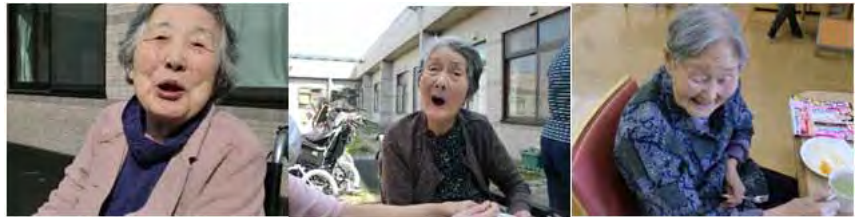
中庭で日向ぼっこ。気持ちの良い季節になりましたね！