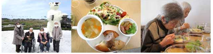
県立美術館に行ってきました