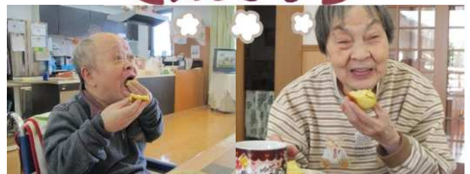
熱々の美味しい焼き芋！大きな口で沢山頬張りました。