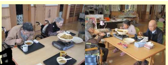
寒い日にはキムチ鍋！辛さで身体はぼかぼかに！