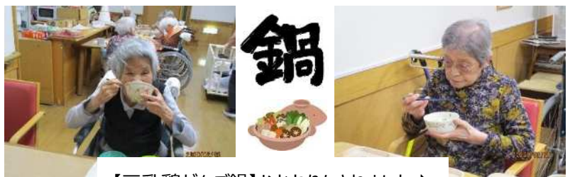
【豆乳鶏だんご鍋】おかわりもされました♪