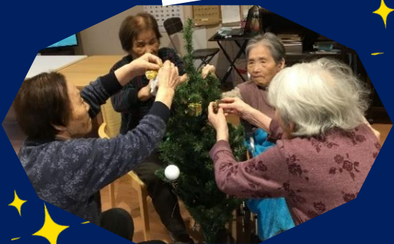
クリスマスの装飾を皆さんと一緒に行いました。 サンタさんが来てくれますように♪