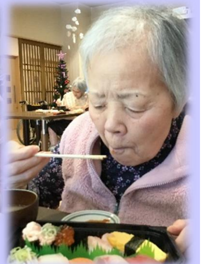
味、ボリューム共に大満足でした！「美味しいわ」と笑顔がこぼれていました(^^)♪