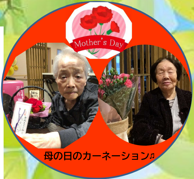
母の日のカーネーション♪