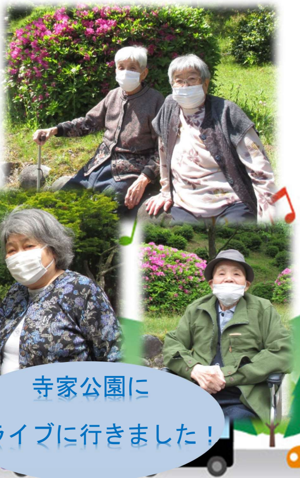
寺家公園に ドライブに行きました！