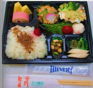
ゆ～とりあ越中のお弁当を テイクアウトしました！