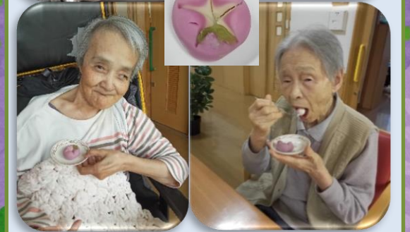
紫陽花の綺麗な季節になりました！