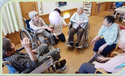
風船バレーしました🎈