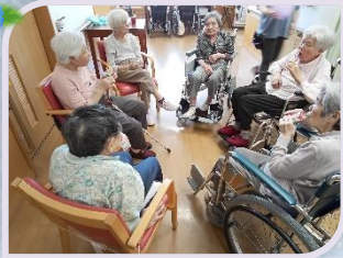
癒しのぬいぐるみ