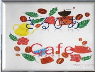
ゆず茶で午後のひと時...