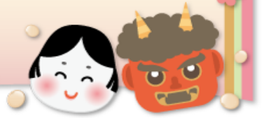
節分に福豆を食べ 笑顔で福を願いました