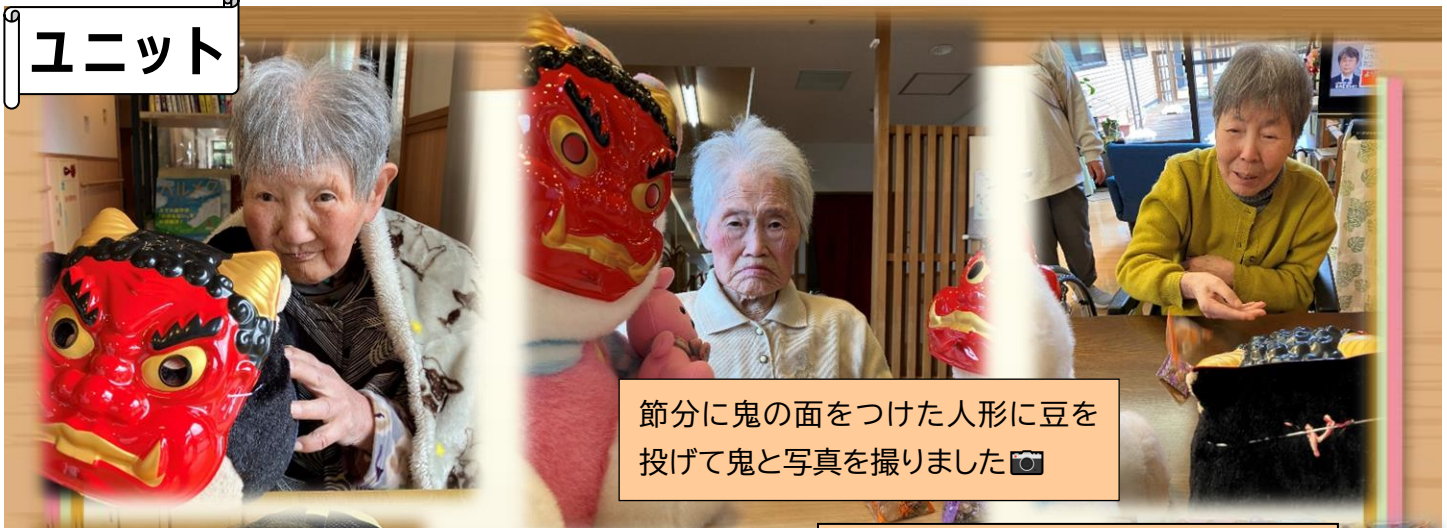
節分に鬼の面をつけた人形に豆を投げて鬼と写真を撮りました📷