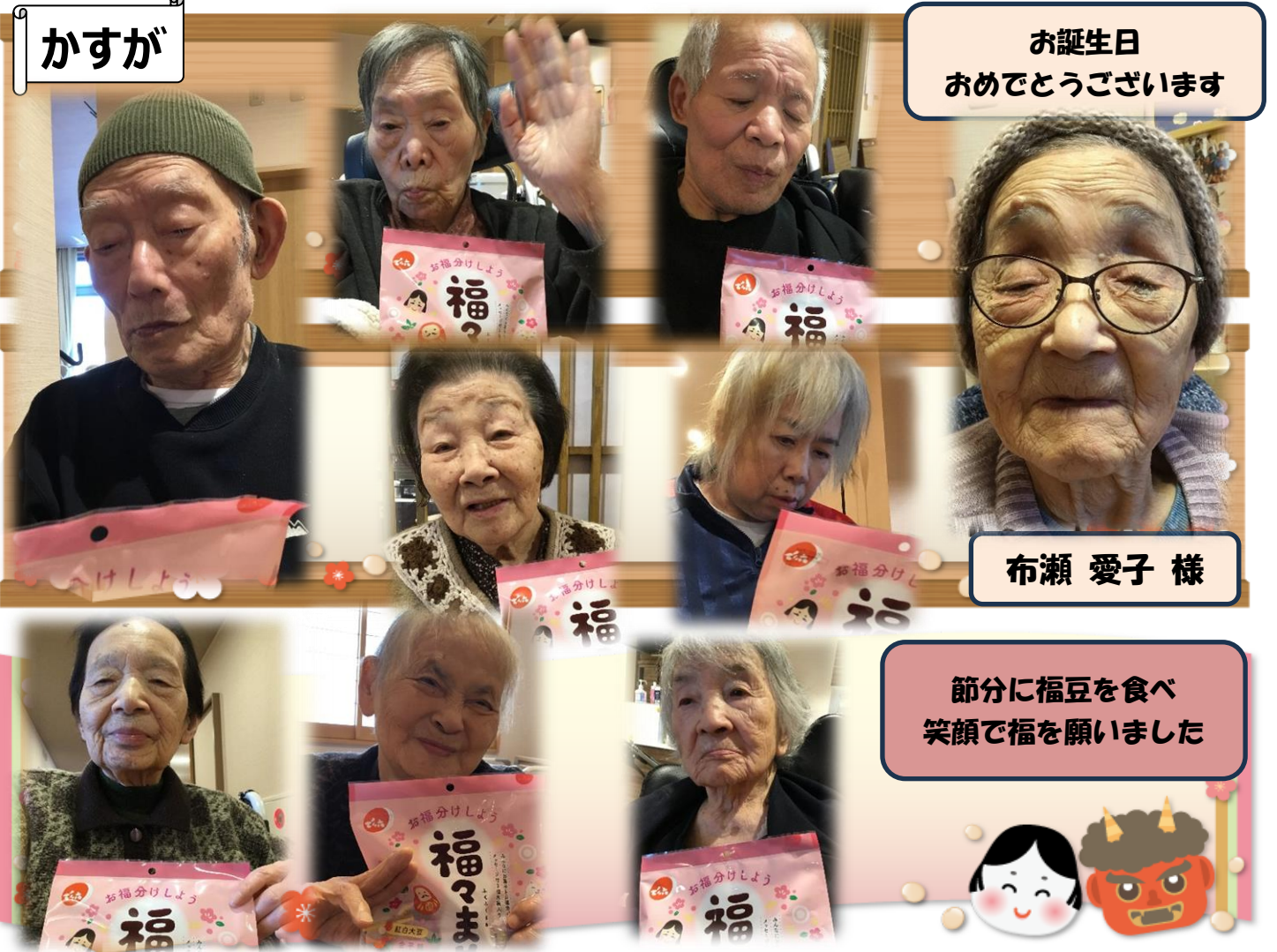
お誕生日 おめでとうございます