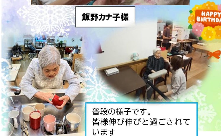
普段の様子です。 皆様伸び伸びと過ごされています