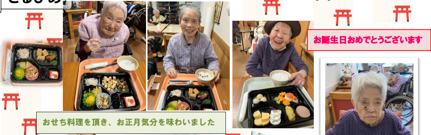
おせち料理を頂き、お正月気分を味わいました